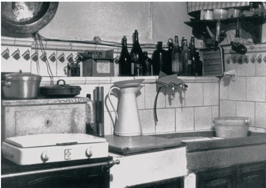
Argazki laborategia Alejandroren sukaldean.