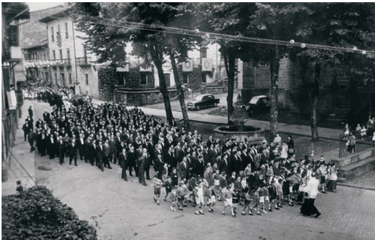
1958/7/4. Prozesioa Valentin Berriotxoaren Deunaren irudiarekin.