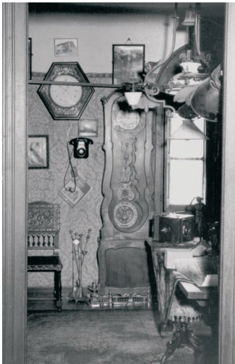
Argazki estudioa egongelan.