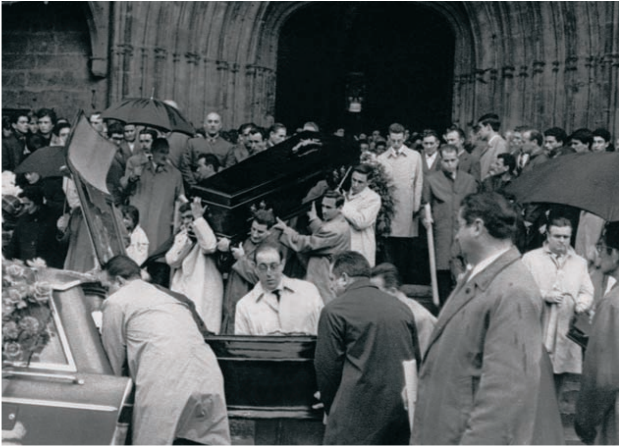
Industrial Cerrajeraren istripuan hildakoen hileta elizkizuna 1966.