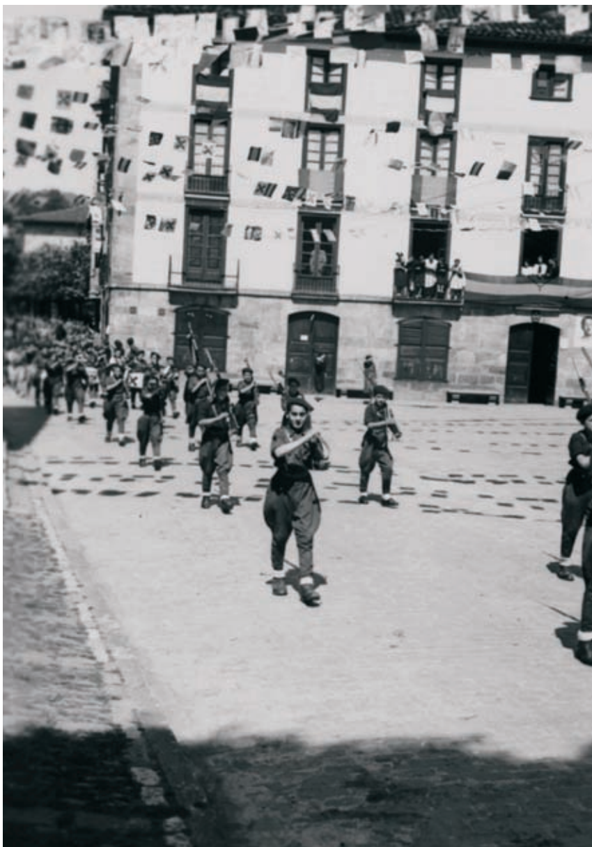
Karlisten desfilea 40. hamarkadan.