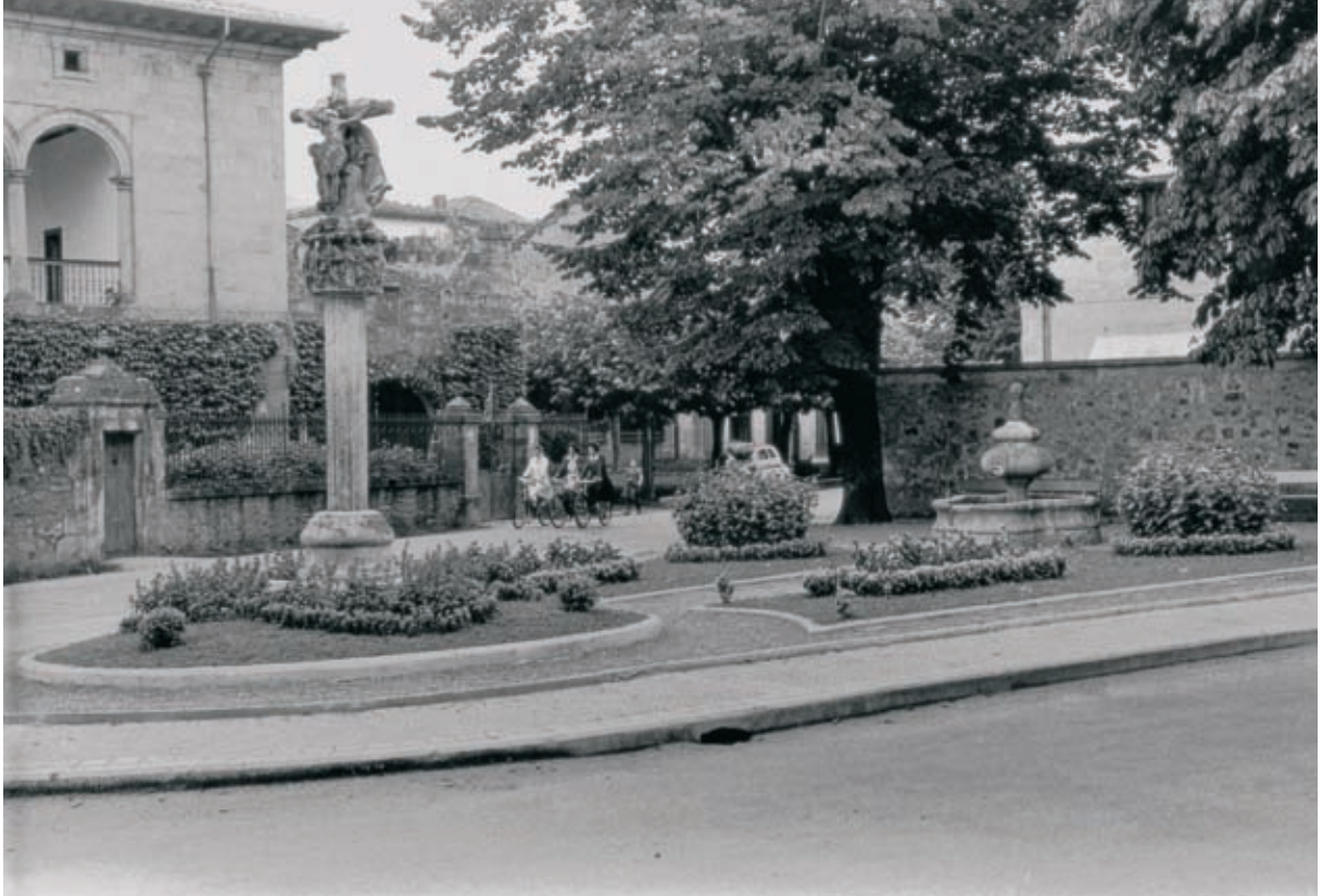
Santa Anako Gurutzea eta lorategia Arespakotxaga jauregi ondoan.