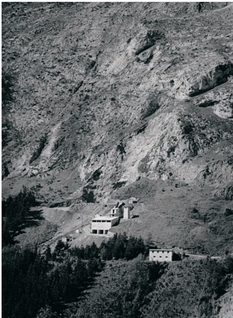
Harrobia Udalaitzen 1961.