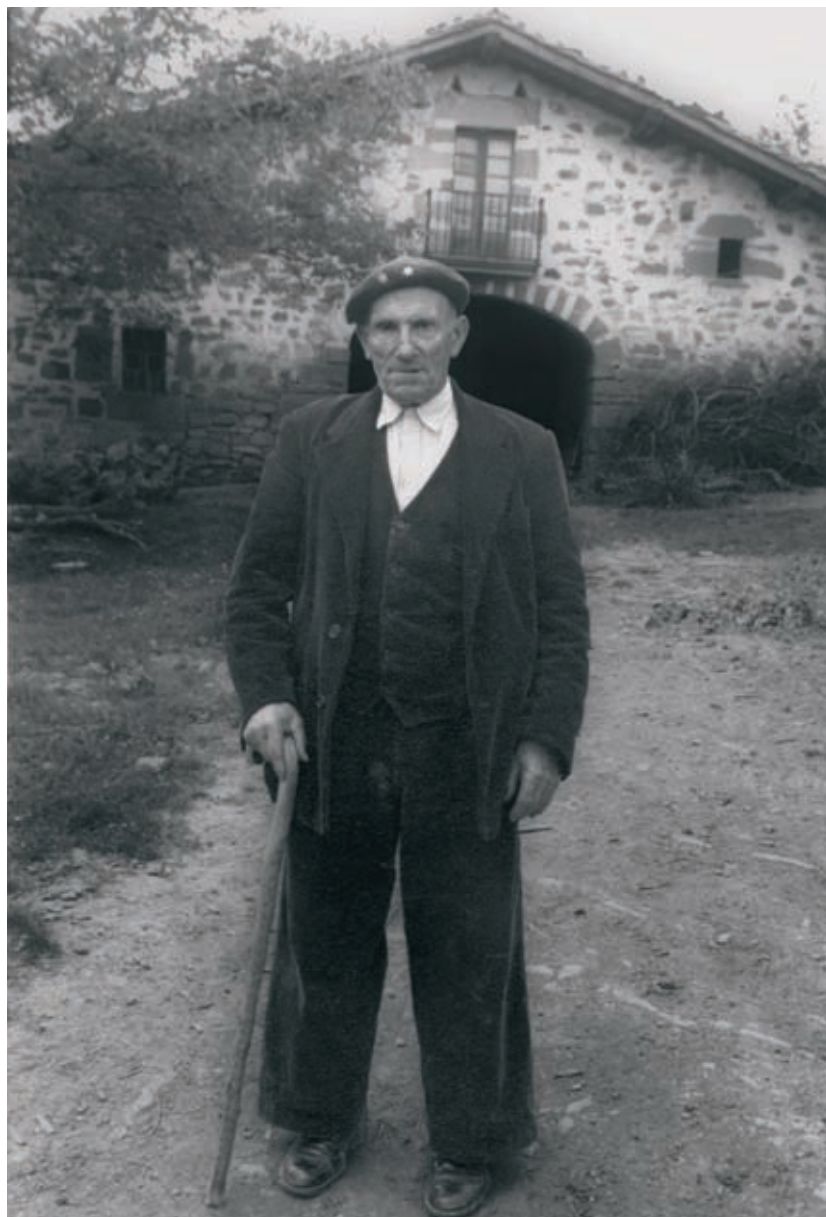
Ohorezko tenientea, 2. Guda karlistan burrukatzeagatik (1873-1876). Berrio auzoko Orbe- Gainekoa baserrian, 40. hamarkada.