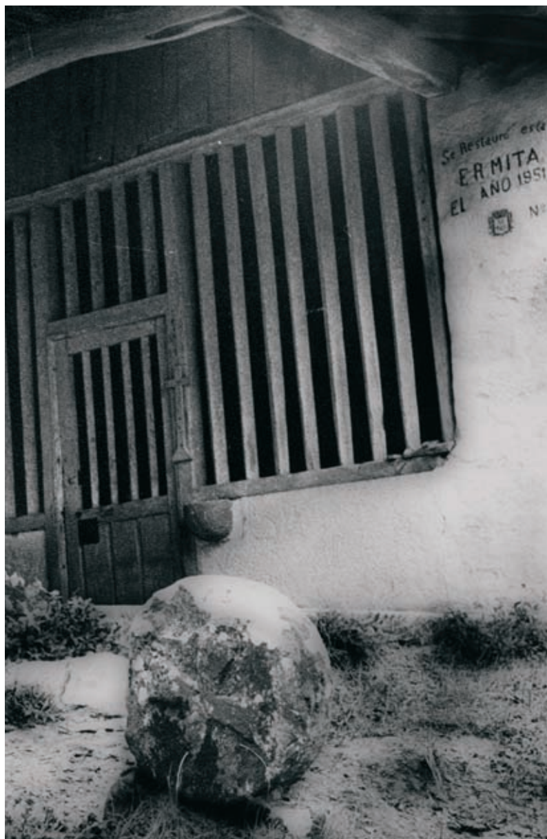
Hilarria Mendrakako Tomas deunaren baselizan 1964.