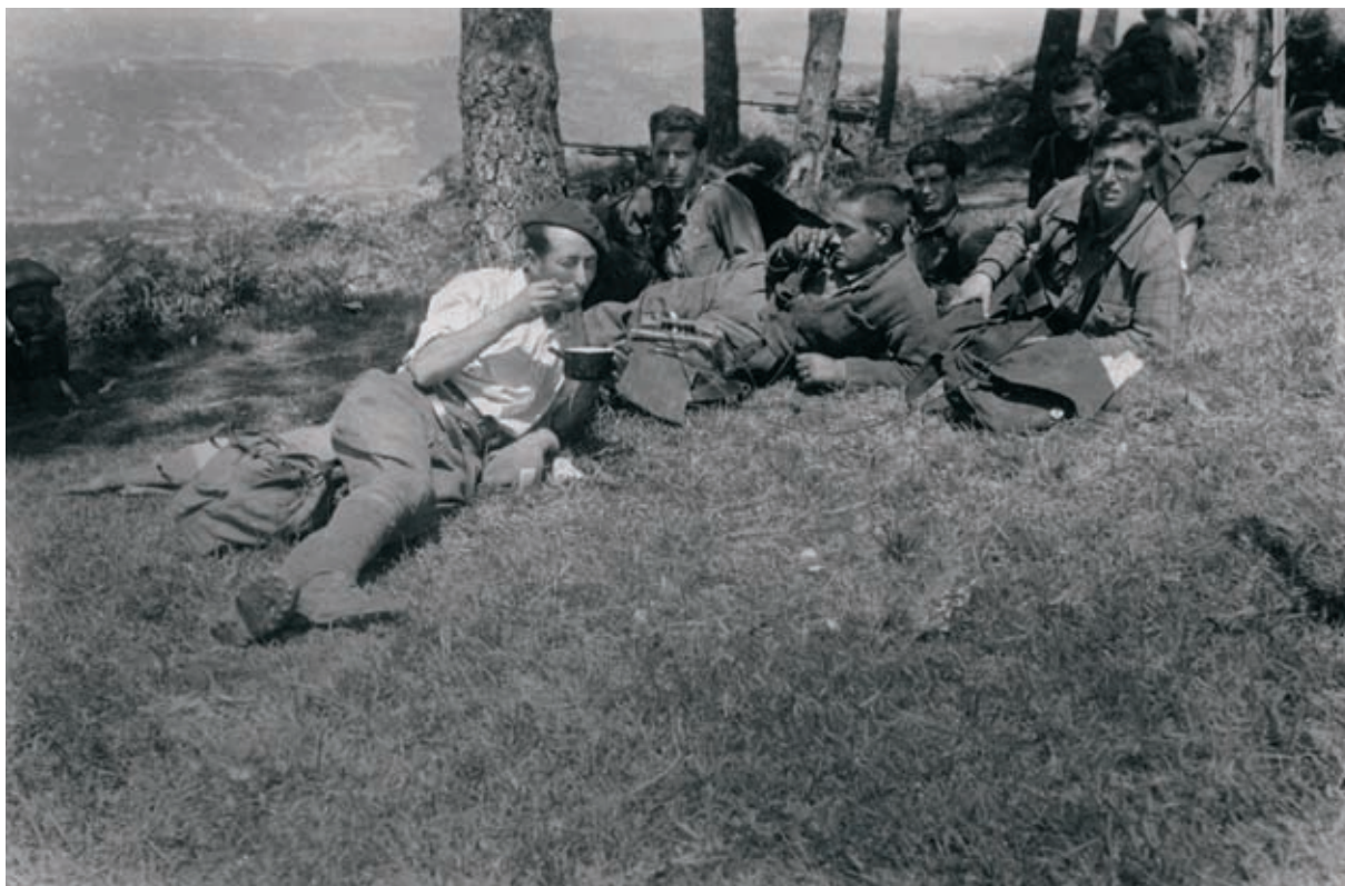
Atsedaldia Bizkaiko frontean 1937.