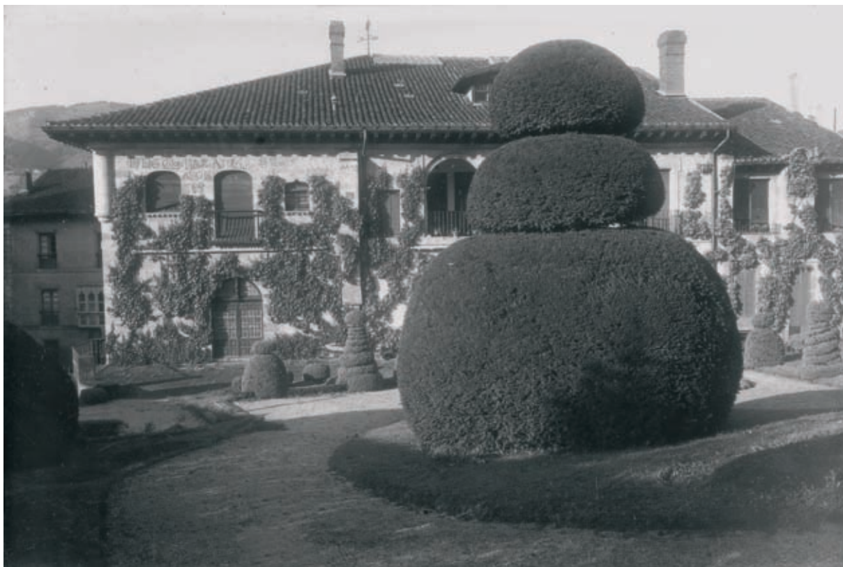
Kasajara jauregiaren lorategia.