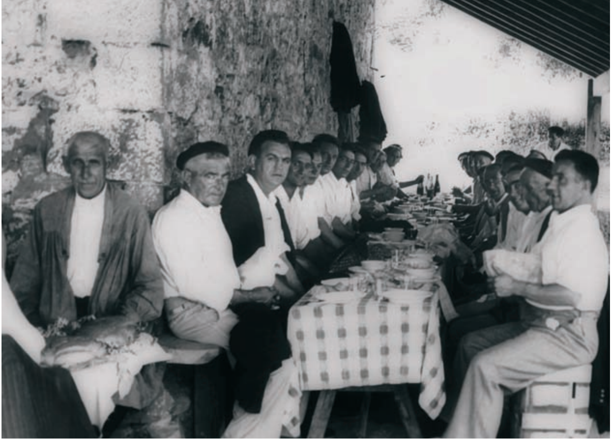
Bazkaria Argiñetan kofradi egunean.