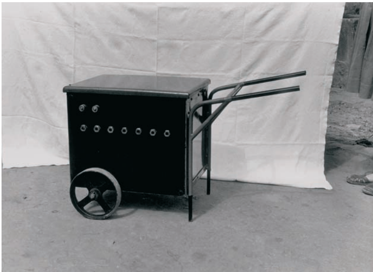
Argazki industrialala 1965.