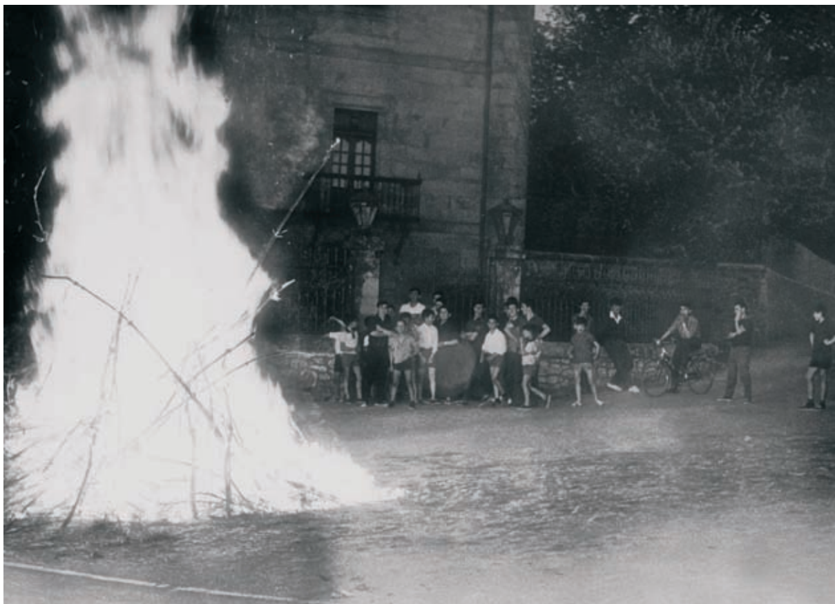
San Juan Sua, Tola jauregi ondoan 1967.