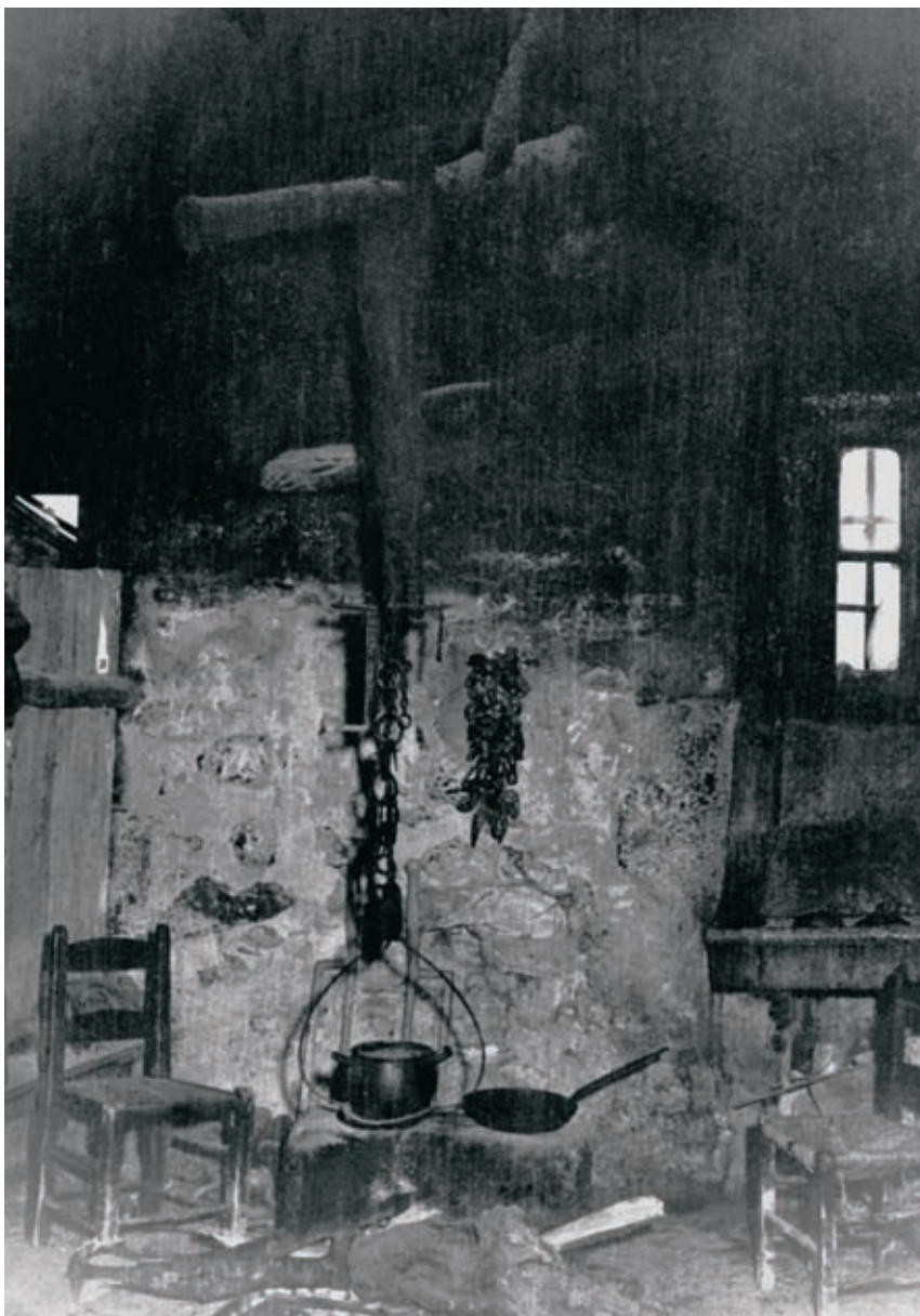
Miota auzoko Estakasolo baserriaren aintzinako sukaldea 1961.