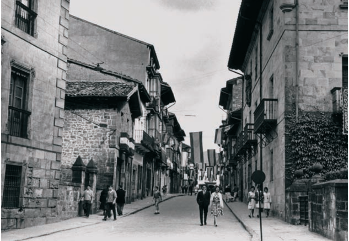
Berriotxoakalea Elorriko jaietan 1968.