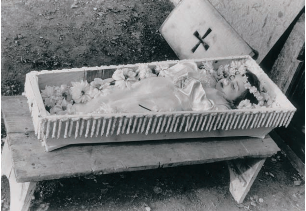
Ume baten gorpua.