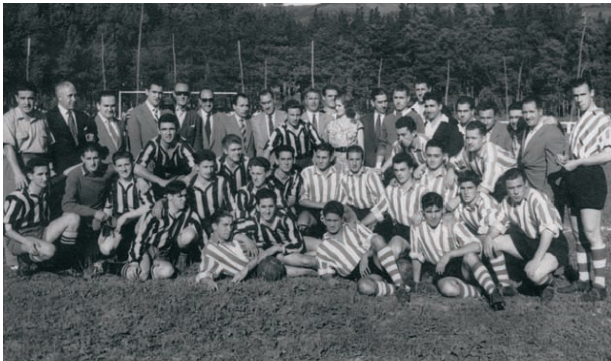
Eleizalde futbol zelaiko tribunaren inaugurazioa. Elorrio eta Athletic futbol taldeak.