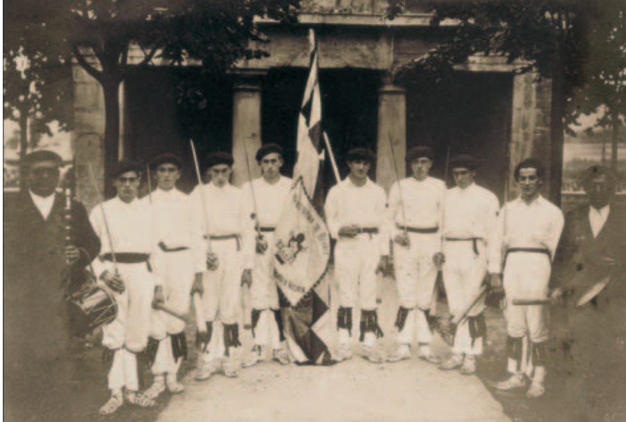
Berrizko dantzariak Durangon, Magdalenan, XVIII. mendeko banderarekin.