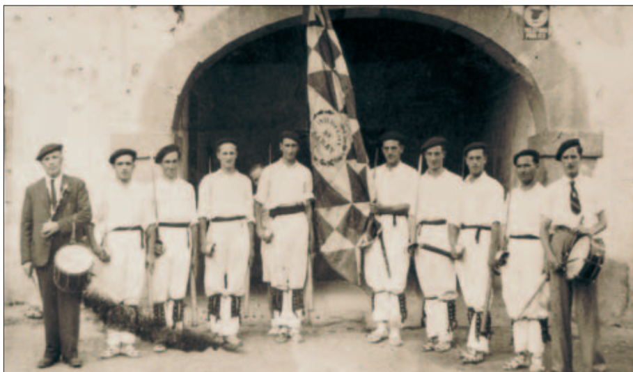
Garaiko dantzariak udaletxe aurrean 1886. urteko banderarekin.