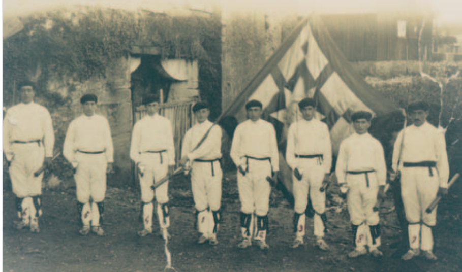
Iurretako dantzariak Montoiko udaletxe ostean XX. mendeko 20.hamarkadan 1911. urteko banderarekin.

En la década de los años 60 y 70 del siglo XX numerosos grupos de danzas adoptaron en su repertorio la dantzari dantza, y para la ejecución del agintariena optaron por confeccionar copias de la bandera de Garai. Este hecho ha generado que en el mundo de las danzas haya un indeterminado número de banderas de Garai que son usados habitualmente en festejos y otros eventos folklóricos.