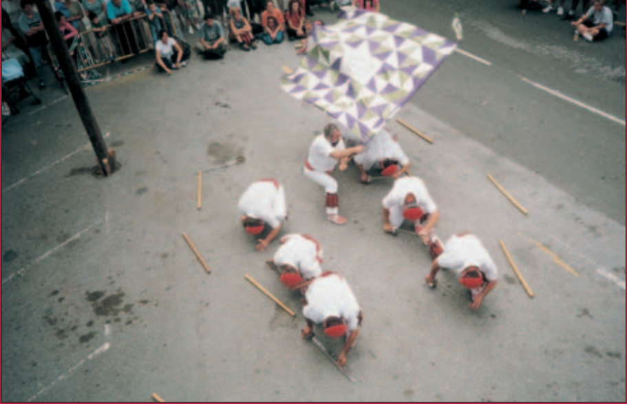
Agintariena Garain Santa Ana egunean.