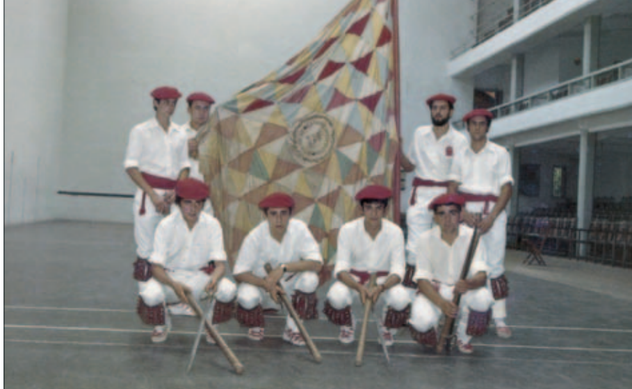
Abadiñoako dantzariak 1896. urteko banderarekin.

seemos de su existencia se remontan a finales del siglo XVI los datos que hemos sacado del archivo municipal son fragmentarios. Conocemos numerosas referencias sobre los avatares de dicha bandera. En los libros de cuentas y actas de la Villa de Durango se nos indica multitud de trasposos de la bandera entre alcaldes, reparaciones, nuevas confecciones etc. Sabemos que era de “tafetán” (1624), “de colores” (1644), “de seda” (1702-1703), “de raso y seda” (1718-1719), también conocemos algunos de sus colores, por ejemplo al ejecutarse una bandera nueva en 1794 se citan “Dámasco carmesí, raso liso blanco, raso azul...” Cuando se confecciona otra las monjas del convento de San Antonio, en 1879, se indica “damasco color carmesí fino y otras sedas flojas de trozal y de coser”. Pero tal y como hemos indicado, por ahora, con lo que se conoce no es posible reconstruir la bandera. Lo que sí conocemos es que la bandera ostentaba por un lado el escudo de Durango y por otro las