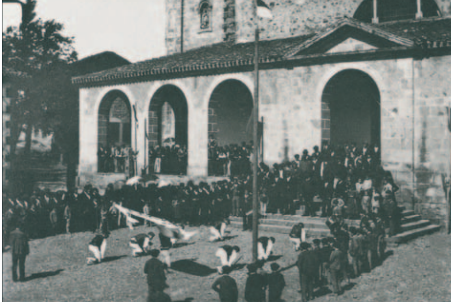
Iurretako dantzariak agintariena dantzatzen. 1891.eko irailaren 29an.

sustituto la bandera, las cajas (tambores), el sello de plata etc. Esta referencia es una constante anualmente hacia el mes de octubre, dado que los alcaldes se sustituían el 29 de septiembre de cada año. En estas anotaciones puntuales se indican algunos datos sobre la misma, en el caso de Durango por ejemplo se indica en 1591 “bandera de tafetán”, en 1593 “bandera del concejo” etc. pero sin mayores concreciones.