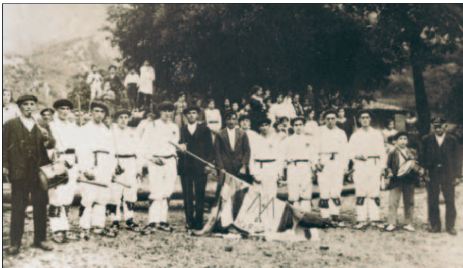
Mañariako dantzariak XX. mendeko 20. hamarkadan 1802. urteko banderarekin.

Liburuxka hau Mañaria eleizateko bandera zaharraren 200. urteurrena eta bandera berriaren aurkezpena dela eta, antolatu den “30. ezpatadantzari egunean” kaleratzen da.