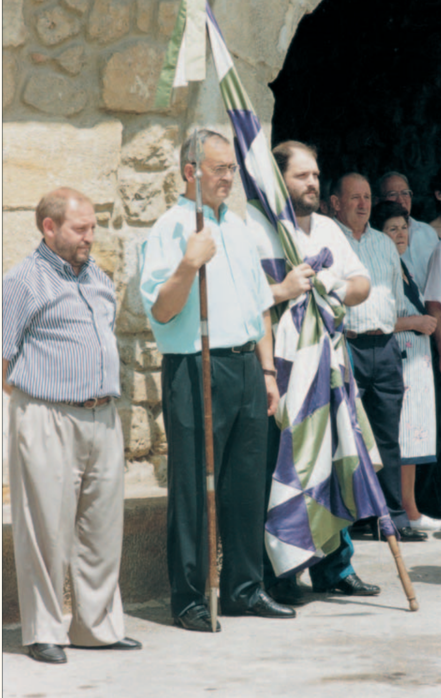
Garaiko agintariak eleizateko txuzo eta banderarekin.