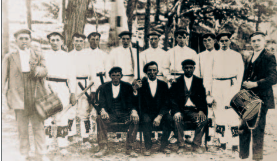
Izurtzako dantzariak eleizateko udalarekin gerra garaian desagertutako banderarekin.

Al igual que en el caso de Garai la de Berriz es otra de las banderas que han copiado muchos grupos folklóricos para utilizarla en el baile de la Dantzari Dantza.