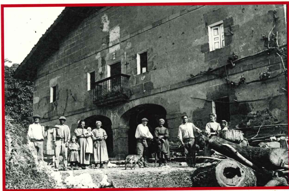
Uribe baserria 30eko hamarkadan.

Mendeak pasatu eta herri antolaketak aldatu ahala kofradiak euren funtzioak galtzen joan ziren. Lehenagoko hain oinarrizko basoak, pribatizazio prozesu baten ondorioz, esku pribatuetara pasatuak ziren. Beste funtzio batzuk elizateko udalak bereganatuak zituen. Iraun zuen elizateko barruti bezala bai hauteskuntetarako edo zergak banatzerakoan. Honen adibide dugu 1714an Abadiñoko elizateko herri kontseilu zabala ezabatu eta beren ordeztu herri asanblada bat antolatzen denean, bertako kideak finkatzerakoan erabakitzen dute partaideak izate elizateko fiela, erregidoreak eta Abadiñoko kofradia bakoitzeko hiru auzokide. Abadiñok sei kofradia zeukan. Bizkaiko Batzar Nagusiak 1704ean Bizkaiko Jaurerriaren errolda edo fogerazioak idazterakoan kofradiak banandu zituzten elizate bakoitzeko etxe eta baserriak. Dena dela XVIII. mendean eta XIX. mendean hasieran herri gehienetan kofradiak erakunde marjinalak ziren.