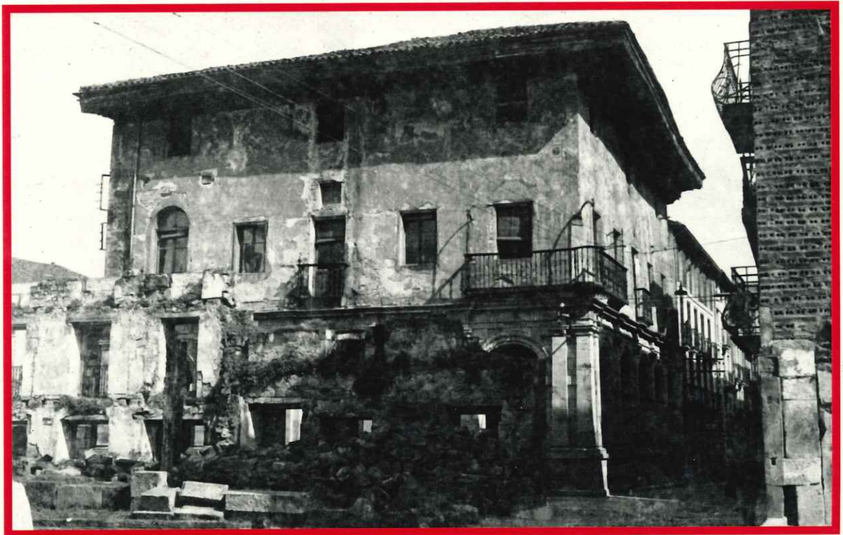
Durangoko udaletxea gerra ostean.

1948an, gerra osteko giro bortitzean, Durangoko udala berriz saiatzen da kofradi basoak bereganatzen. Azaroaren 3an izandako udal batzarrean erabakitzen dute: