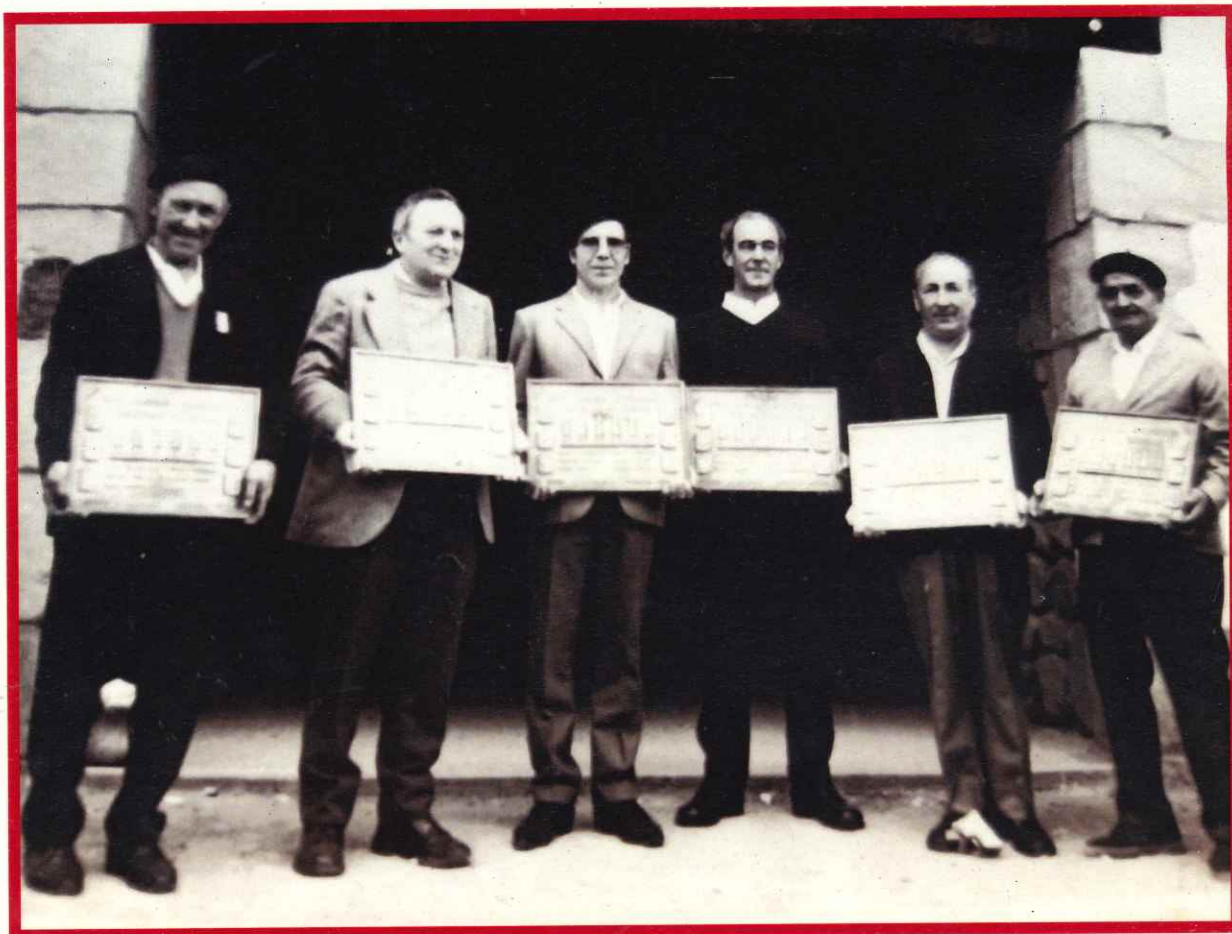
lurretako sei kofradietako gizon-onak 1973an.